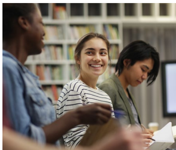
7 – PAARI, personnes Autistes pour une Autodétermination Responsable et Innovante

De manière générale, il existe des difficultés à maîtriser le processus de candidature et notamment l'entretien d'embauche. Les difficultés portent également sur la communication et l'interaction avec l'environnement de travail et l'intégration à la culture d'entreprise. Des barrières plus spécifiques à la France accroissent ces difficultés comme le manque d'informations, de sensibilisations et de formations du monde de l'entreprise comme du milieu spécialisé concernant les droits et moyens pour favoriser l'inclusion professionnelle des personnes autistes.