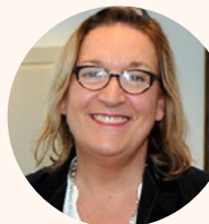
CLAIRE COMPAGNON, Déléguée interministérielle, à la stratégie nationale pour l'autisme au sein de troubles du neuro-développement